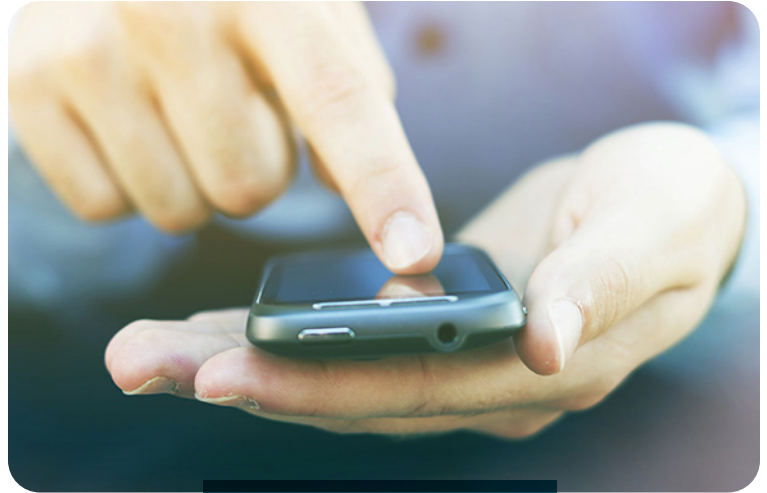
여러분의 목소리는 중요합니다.

이해 상충을 야기하거나 이해 상충으로 보일 수 있는 상황을 피하려면, Littelfuse 외부에서의 고용, 개인적 관계(친구 및 가족 포함), 선물 및 접대, 개인적 투자 및 대출 또는 타인과 주고 받는 호의를 다루는 경우에 주의하십시오.