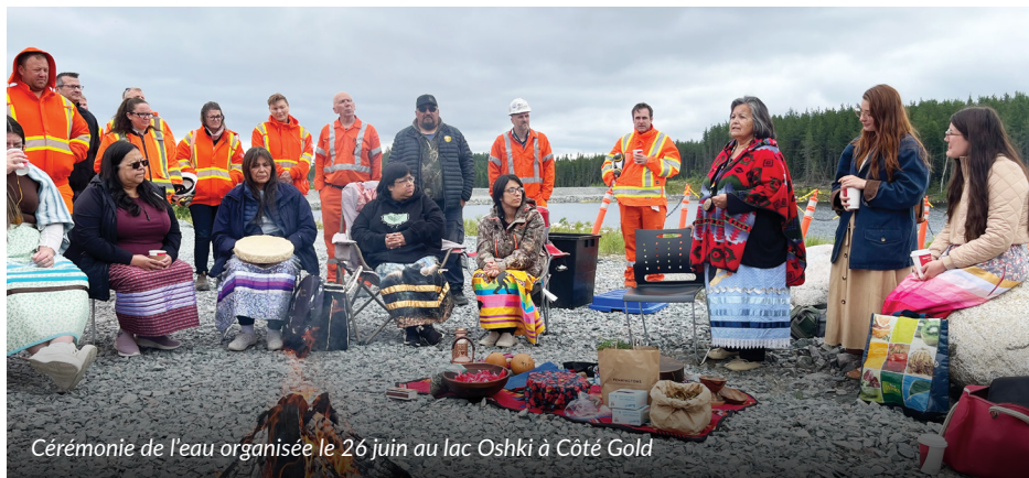
Cérémonie de l'eau organisée le 26 juin au lac Oshki à Côté Gold

Étapes importantes des activités à Côté Gold