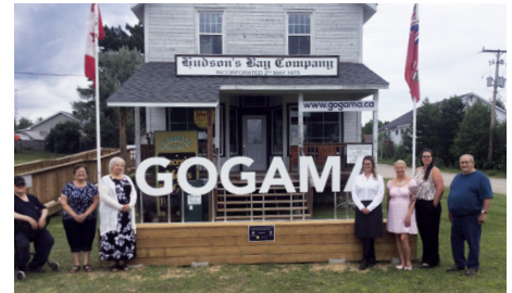
Moments de collaboration qui témoignent de l'engagement entre Côté Gold et la communauté de Gogama