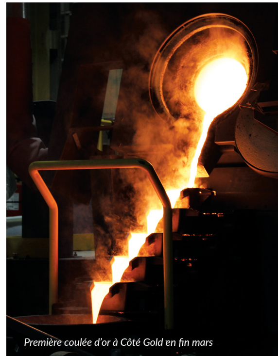
Première coulée d'or à Côté Gold en fin mars

Plus d'informations sur cette étape importante à la page 3