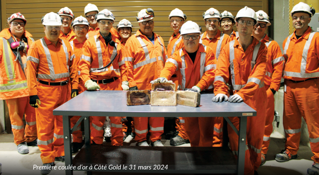
Première coulée d'or à Côté Gold le 31 mars 2024