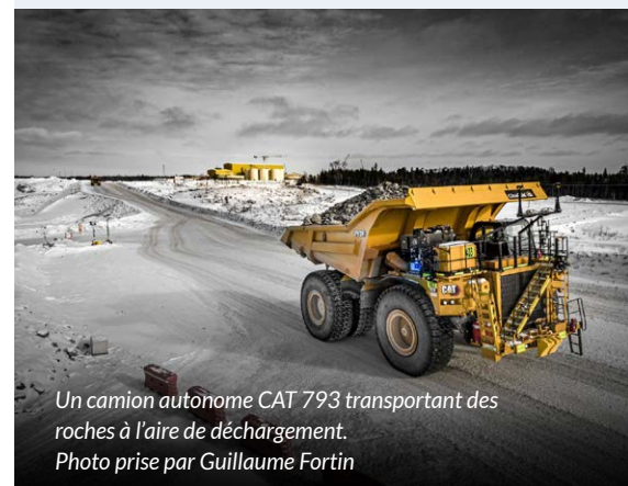
Un camion autonome CAT 793 transportant des roches à l'aire de déchargement.