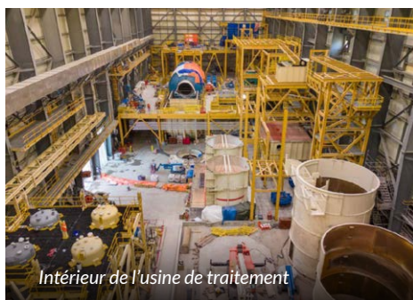
Intérieur de l'usine de traitement

L'équipe de Côté Gold a travaillé fort pour adapter, tester et déployer le logiciel de gestion de santé, sécurité et environnement (SSE) de l'entreprise, appelé Intalex. Cette plateforme nous permet de faire le suivi de nos données en SSE et de les déclarer, d'analyser les tendances et de tirer des leçons afin de nous aider à continuer d'intégrer la santé, la sécurité et l'environnement dans nos activités quotidiennes et à atteindre notre vision Zéro Incident®.