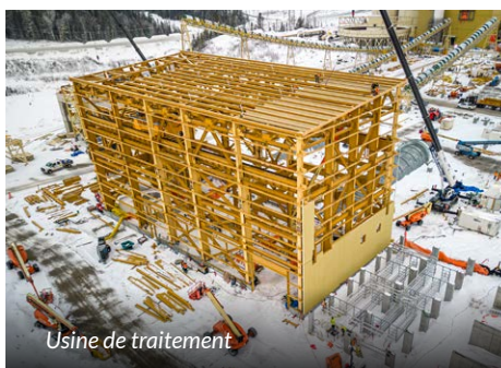
Usine de traitement