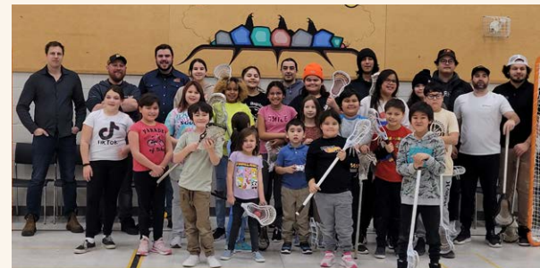
▲ Des jeunes prenant part à l'atelier de crosse

Côté Gold s'efforce de créer et d'entretenir des partenariats durables avec les communautés où il exerce ses activités, et encourage ses entrepreneurs à tisser des relations avec ses partenaires autochtones et communautaires. Dans le cadre de son engagement envers la jeunesse de la Première Nation de Mattagami, Englobe, un entrepreneur travaillant pour Côté Gold, a parrainé un atelier de crosse de deux jours à l'intention des jeunes de la 1 re à la 8 e année (primaire et secondaire I et II), organisé par Nationwide Lacrosse au centre communautaire-aréna Mattagami Odamino au début de janvier. L'atelier a été offert par des joueurs de crosse professionnels de la National Lacrosse League. Les coaches ont parlé des origines de la crosse et des racines profondes autochtones de ce « jeu-médecine » ainsi que des différentes expériences et occasions auxquelles ils ont pu prendre part grâce à la crosse.